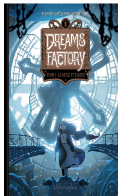
Dreams factory Zako Suheb (Soleil)