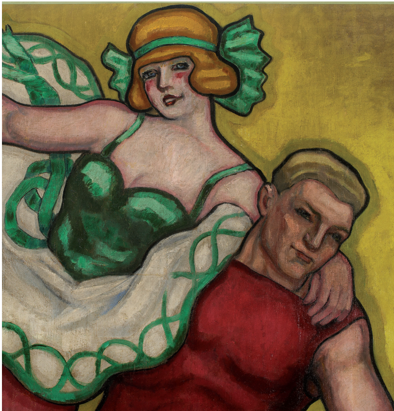
Les Voltigeurs © Charlie Abad, musée des Beaux-Arts de Limoges.

Le décor réalisé par Widhopff pour le Cirque-Théâtre était celui-ci : quatorze scènes peintes décoraient la salle de spectacle, placées au-dessus des gradins. Ces grandes huiles sur toile étaient marouflées sur les murs, séparées par d'autres panneaux peints décoratifs ornés de rideaux feints ou de guirlandes de fleur. À cela, s'ajoutaient des peintures dans les espaces accessibles au public : entrée, vestibule, buvette et promenoir. Au total, pas moins de 400 m 2 de peinture ont été exécutés par Widhopff en une année, depuis Paris où il vivait et Roanne où il disposait d'un atelier. L'artiste vint faire les derniers ajustements à Limoges, une fois les toiles acheminées et montées.