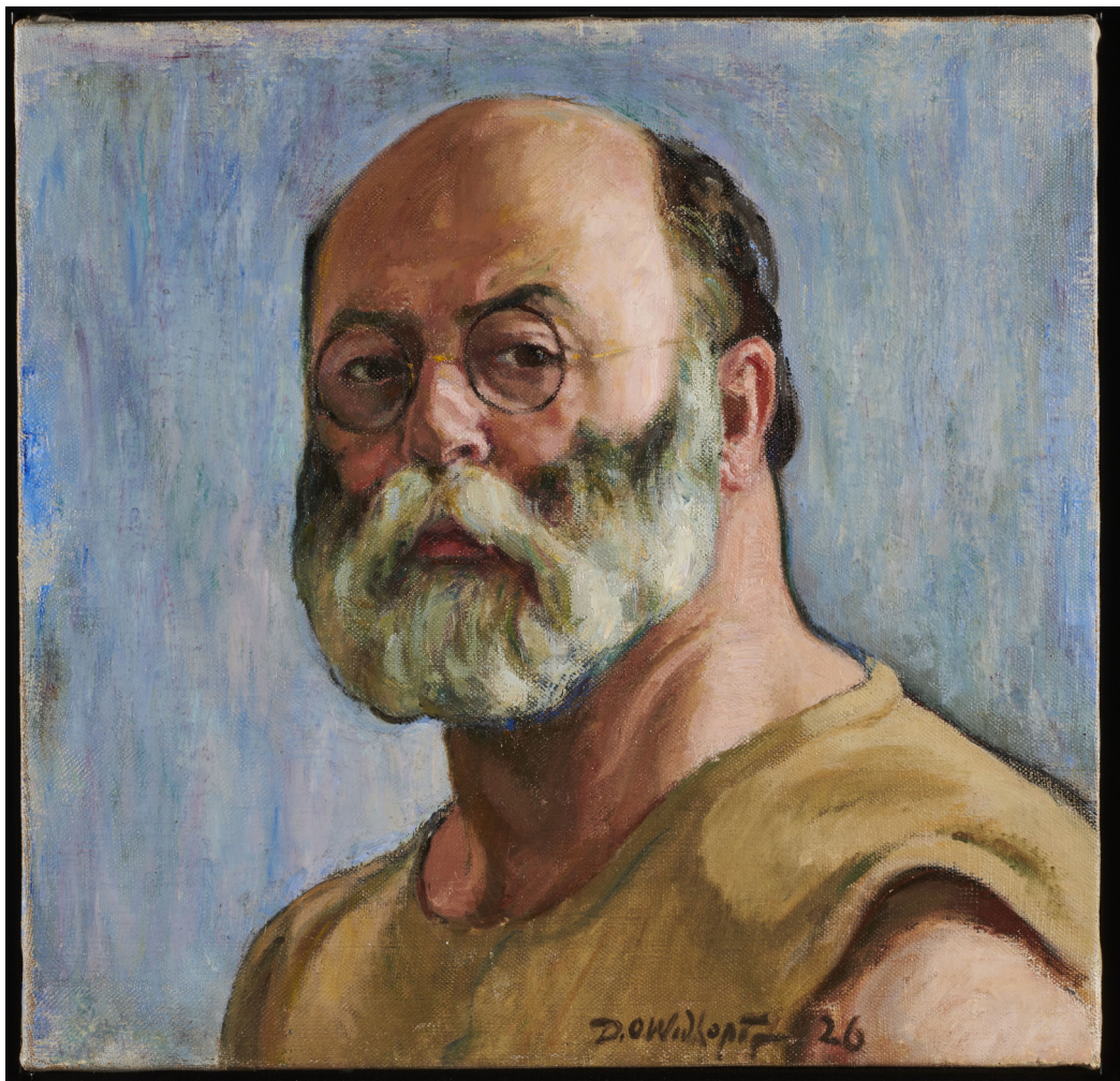
Autoportrait de David Ossipovitch Widhopff

À partir de 1927, Widhopff s'ouvre aux arts décoratifs et entame une collaboration avec la Manufacture nationale de Beauvais : ses dessins servent de cartons pour les tapisseries de meubles où il déploie un vocabulaire de guirlandes de fleurs, d'amours ou de cornes d'abondance, dans des coloris vifs et contrebalançant la pureté des lignes des ébénistes Armand-Albert Rateau ou Maurice Dufrené. Il réalisera aussi les motifs pour des modèles de sac à main dans les années 1928 et 1930, accessoire essentiel de la garde-robe féminine à partir des Années folles.