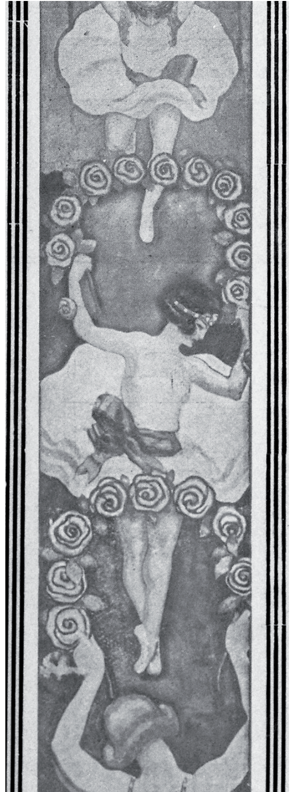
Danseuses (détail)

Cinq toiles conservées au musée des Beaux-arts de Limoges, quelques vitrines, un fragment de façade et de rares archives permettent aujourd'hui de proposer une évocation de ce lieu, témoin d'une part de l'histoire de la ville, et écrin de la réalisation la plus ambitieuse d'un peintre méconnu, à la carrière pourtant prolifique entre la Belle Époque et les Années folles.