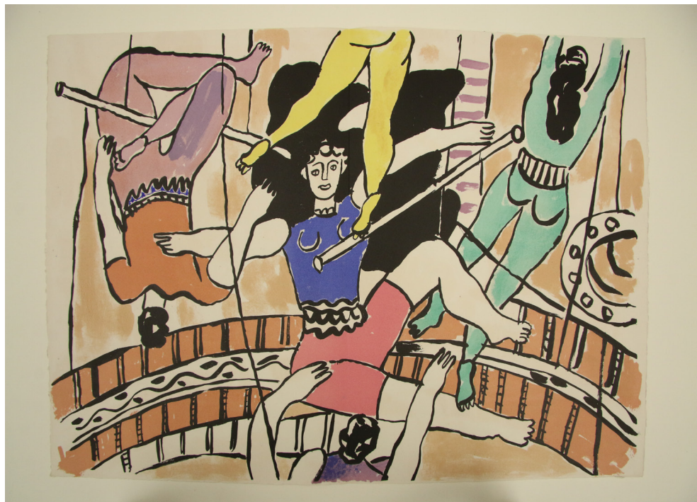
Le Cirque © F. Magnoux, musée des Beaux-Arts de Limoges / ADAGP, Paris, 2024

Un lieu emblématique de cette émulation artistique est le Cirque Fernando à Paris (devenu le cirque Medrano en 1897). De nombreux artistes s'y pressent et rendent compte de leurs émotions de spectateurs : parmi eux, Toulouse-Lautrec, Auguste Renoir, Georges Seurat, Kees van Dongen ou plus tardivement Pablo Picasso et Fernand Léger . Leurs œuvres diffusent l'image d'un lieu populaire et féerique. Le cirque, sujet moderne, fascine ainsi l'avant-garde artistique et s'accorde avec la modernité des styles.