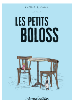
Les petits boloss de Ruppert & Mulot (L'Association)

Le « prix des lecteurs BD » est soumis au vote du public et désigne un lauréat entre 3 ouvrages de type roman graphique, manga, comics ou franco-belge. Pour participer, il suffit de compléter le questionnaire en ligne et de choisir sa BD 2021 préférée parmi les 3 ouvrages sélectionnés (ci-dessous) avant le 12 avril.