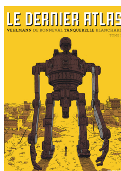
Le Dernier Atlas, Tome 2 de Fred Blanchard, Gwen de Bonneval, Hervé Tanquerelle et Fabien Vehlmann (Dupuis)