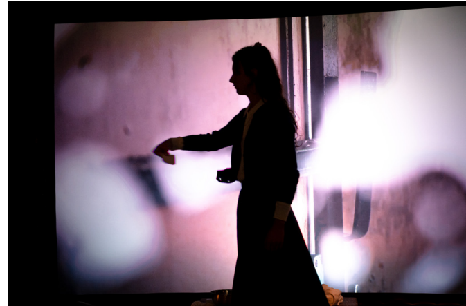
L'Ange Esmeralda

L'Ange Esmeralda , adapté de la nouvelle de Don DeLillo, traduit toute la violence de l'Histoire si présente dans l'œuvre de l'auteur. Deux sœurs religieuses – Edgar et Gracie – tentent de retrouver une orpheline, en se liant avec Ismael, chef de gang et gardien du quartier. Histoire populaire bouleversante, les personnages protègent les habitants miséreux dans un quartier déshérité du Bronx.