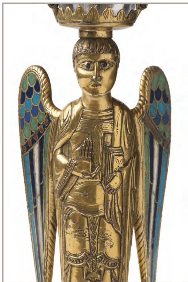
Statuette d'ange monté en reliquaire, détail Limoges, 1120-1140. Musée des Beaux-Arts de Limoges, inv. 2004.D1.1 (dépôt de la commune de Saint-Sulpice-les-Feuilles)

À l'occasion de l'exposition « Dans les collections de la BnF : Chefs-d'œuvre romans de Saint-Martial de Limoges », la Ville de Limoges est heureuse de s'associer à la Bibliothèque nationale de France (BnF) pour présenter, du 23 novembre 2019 au 24 février 2020, au musée des Beaux-Arts de Limoges quatorze manuscrits enluminés provenant de la bibliothèque médiévale de l'abbaye.