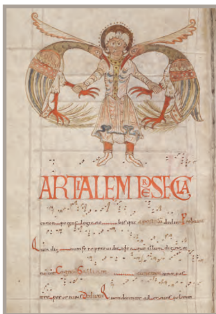
LATIN 1121 - f. 28V

À cette occasion, la Bibliothèque nationale de France a exceptionnellement accordé le prêt de quatorze manuscrits médiévaux (IX e -XII e siècles) provenant de l'ancienne abbaye Saint-Martial de Limoges . Conservées pour la plupart depuis 1730 dans les collections de la Bibliothèque royale, ces pièces de choix illustrent l'histoire de son scriptorium *p.15 , à l'époque romane. Ces ouvrages précieux et uniques, destinés aux célébrations chrétiennes, vont de ses débuts (Première Bible de Saint-Martial, Lectionnaire de Saint-Martial...), jusqu'à son âge d'or (Seconde Bible de Saint-Martial, Vie de saint Martial...), en passant par l'évocation des autres foyers de production apparentés (Sacramentaire de la cathédrale Saint-Étienne de Limoges, Tropaire-prosier d'Auch).