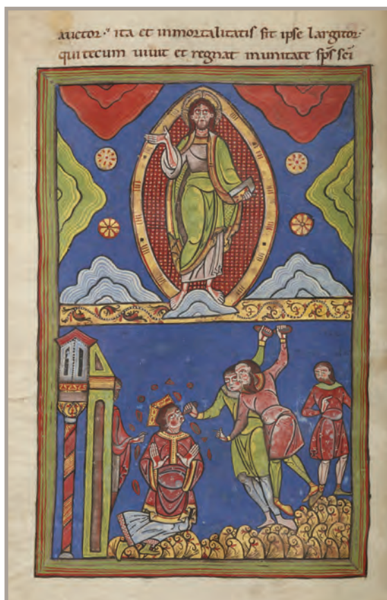
LATIN 9438 - f. 20V

Ces caractéristiques se combinent avec le style aquitain propre à Saint-Martial qui se manifeste avec éclat chez le maître principal de la Seconde Bible comme chez les artistes qui lui sont apparentés. L'artiste du somptueux Sacramentaire de la cathédrale Saint-Étienne se rattache lui aussi à ce courant, en faisant de la couleur un élément essentiel de ses compositions et en s'inspirant d'autres domaines artistiques, comme la peinture monumentale, le vitrail, l'orfèvrerie ou l'émail.