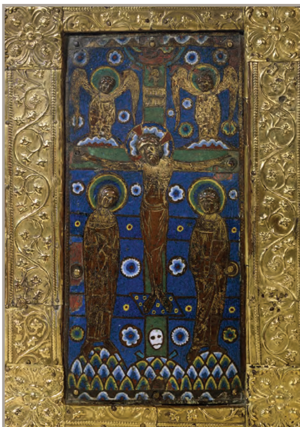
Plat de reliure d'un évangélaire, manuscrit Smith-Lesouef

Les reliques du premier évêque de Limoges, exposées sur l'autel principal de la basilique du Sauveur, et son tombeau, qui se trouvait dans l'église Saint-Pierre-du-Sépulcre, attiraient des foules de pèlerins dont il s'agissait de canaliser le parcours au sein du sanctuaire. La promotion du culte martialien et des autres saints dont l'abbaye possédait des reliques s'est accompagnée d'une intense activité liturgique et musicale dont témoignent les nombreux manuscrits copiés , entre le milieu du X e siècle et le début du XII e siècle, dans son scriptorium , atelier ayant pu se trouver à proximité du cloître. Les catalogues successifs de la bibliothèque de Saint-Martial, riche de près de 450 volumes au début du XIII e siècle , montrent que ces manuscrits tiennent une place importante dans la vie spirituelle de l'abbaye, laquelle résonnait de musique.