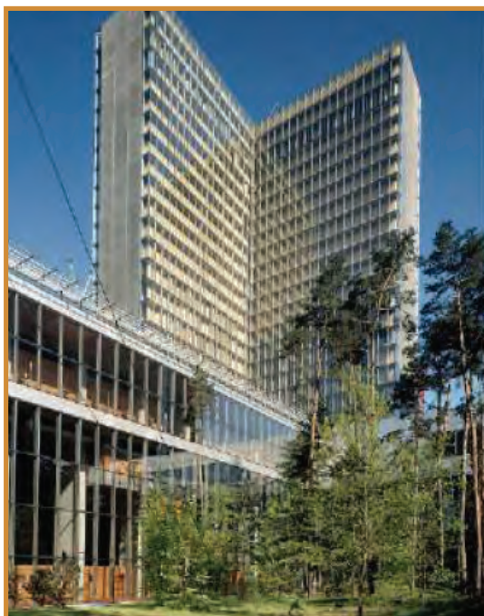
BnF | François Mitterrand