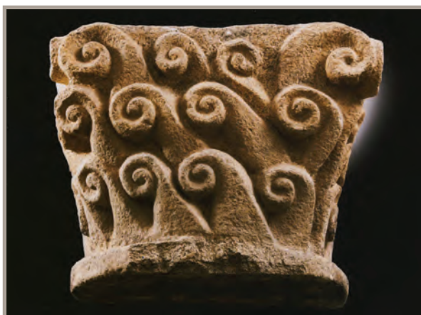
Chapiteau à décor de crosses, Limoges, 2 e tiers du XI e siècle. Musée des Beaux-Arts de Limoges, inv. Arc. L. 211

La Révolution passée, les ruines de l'ancienne abbaye qui pouvaient subsister sont remblayées et nivelées en 1806, afin de transformer cette aire de désolation en place publique. Là où se trouvait jadis la nef de la basilique du Sauveur, est percée la rue Saint-Martial qui prolonge la rue du Clocher ainsi dénommée, car ayant naguère menée à son clocher-porche. Son souvenir s'estompe pourtant, malgré des trouvailles récurrentes chaque fois que de nouvelles constructions obligent à donner des coups de pioche dans ce périmètre urbain (1837, 1844, 1892, 1914...).