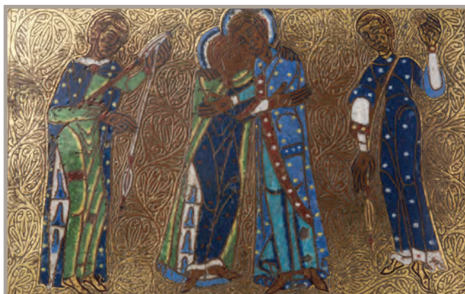
Fig. 5. Plaque : la Visitation / Limoges, 1170-1180 / Musée des Beaux-Arts de Limoges, inv. 92.482

Réservation : obligatoire jusqu'à la veille de la visite au 05 55 45 98 10