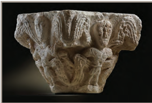
Chapiteau à décor de chérubins Arc. L. 50

Voici plus de mille ans, en 1018, commençait la construction de la principale église située au cœur de Saint-Martial, la basilique romane du Sauveur, l'un des édifices les plus emblématiques du XI e siècle. Le prestige de cette abbaye reposait sur la réputation du premier évêque de Limoges, Martial, personnage ayant vécu au détour des III e -IV e siècles, dont elle conservait les reliques. Depuis 855, année au cours de laquelle sa basilique primitive aurait servi de cadre au couronnement et au sacre d'un roi d'Aquitaine, elle s'efforçait de le faire reconnaître comme le grand protecteur des princes Aquitains.