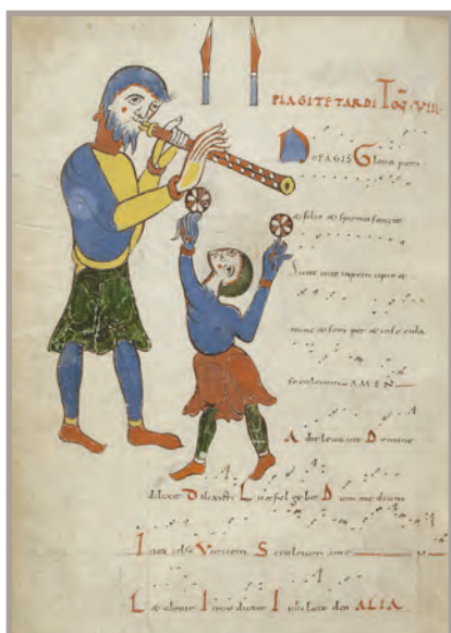
LATIN 1118- FOL 112V

> Concert de l'Ensemble Cum Jubilo, « Chants et tropes. École de Saint-Martial » Dimanche 1 er décembre à 15h