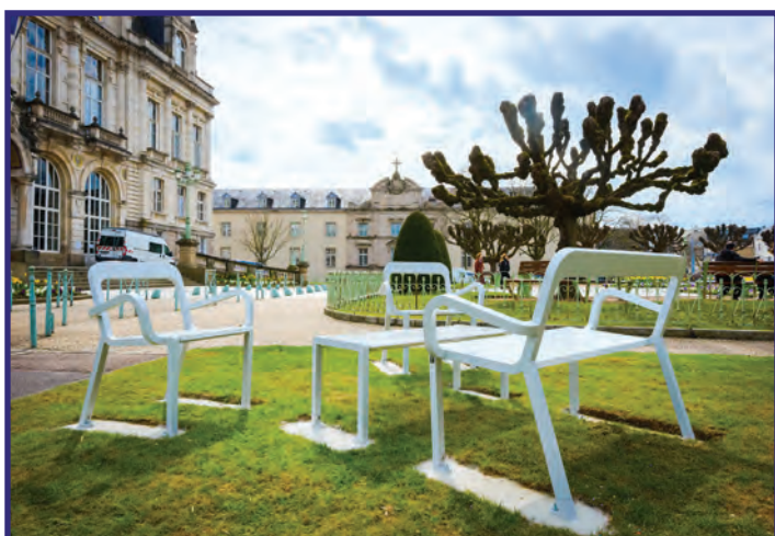
Salon en céramique