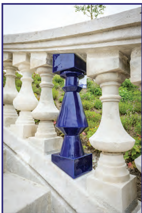
Balustre au Jardin d'Orsay

Dans le cadre de sa politique de développement urbain, la Ville de Limoges, Ville créative de l'Unesco depuis octobre 2017 s'engage dans des projets de développement et de valorisation de la céramique et se positionne comme un des promoteurs de ce savoir-faire. La création d'un jalonnement en céramique dans le centre-ville fait partie de cette initiative de mise en valeur avec un plan de financement d'environ 222 500 euros. C'est ainsi qu'une vingtaine de pièces en porcelaine « bleu de four » destinées à réparer ce que le temps a dégradé ou à sublimer certains lieux, seront disséminées dans l'espace public invitant ainsi le promeneur à déambuler et découvrir la ville sous un nouvel angle.