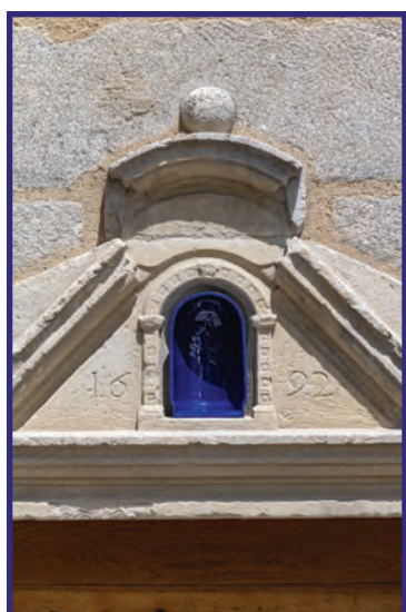
Niche place de la Motte

Cette série d'objets propose de regarder la ville comme un domaine plastique que l'on peut modeler, transformer et réimaginer. L'équipe a repéré des éléments architectoniques auxquels elle a appliqué des transformations géométriques : symétries, homothéties, élongations, duplications. Chacune de ces interventions est une petite sculpture qui agit comme un reflet déformé interrogeant la ville et la céramique dans un même geste. Par exemple, la corniche de la rue Gaignolle propose un jeu avec la forme architecturale et le passé de la ville tandis que la niche place de la Motte met en scène le retrait de 14 % d'un volume de porcelaine au cours de la cuisson.