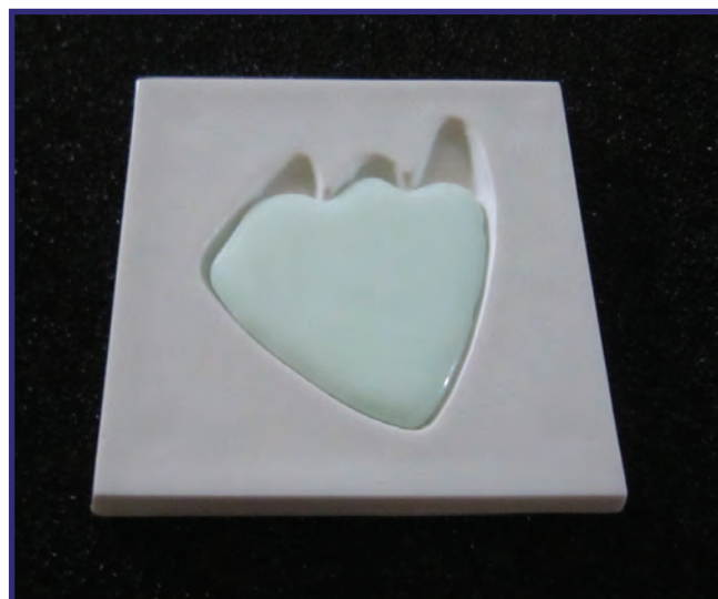
Pavé céramique photoluminescent