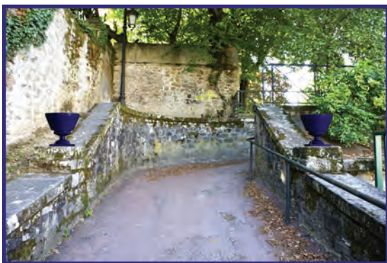
Remplacement de deux vasques au Jardin d'Orsay

Chacune des interventions donne une version céramique d'un élément manquant dans la ville. Ces manques qui ont été repérés par l'équipe lauréate concernent principalement des objets sériels comme des éléments de balustrades ou des objets ornementaux. Ces remplacements visent à restituer ici un alignement, là une harmonie d'ensemble tout en introduisant un décalage par la juxtaposition de la porcelaine avec les matériaux de la ville (pierre, métal). La part d'invention dans la forme des objets a donc été réduite au minimum pour proposer une interprétation simple des éléments initiaux.