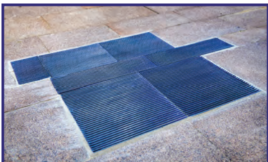
Dallage rue Adrien Dubouché

Une intention essentielle du projet est de considérer le banal, l'ordinaire, comme un support possible à un geste artistique dans la ville. Cette série d'interventions s'attarde sur des éléments a priori sans valeur parce qu'ils sont hors d'usage, qu'ils semblent maladroitement agencés ou encore parce qu'ils relèvent moins d'une intention que d'une pure contingence technique. La démarche consiste ici à tirer parti de ces situations et à en inverser la perception habituelle par un geste esthétique. Le dallage de la rue Adrien Dubouché, par exemple, fait œuvre d'une simple reprise de sol. Dans d'autres cas c'est à une réparation discrète mais indispensable comme avec le remplacement du n°8 de la rue Othon Péconnet.