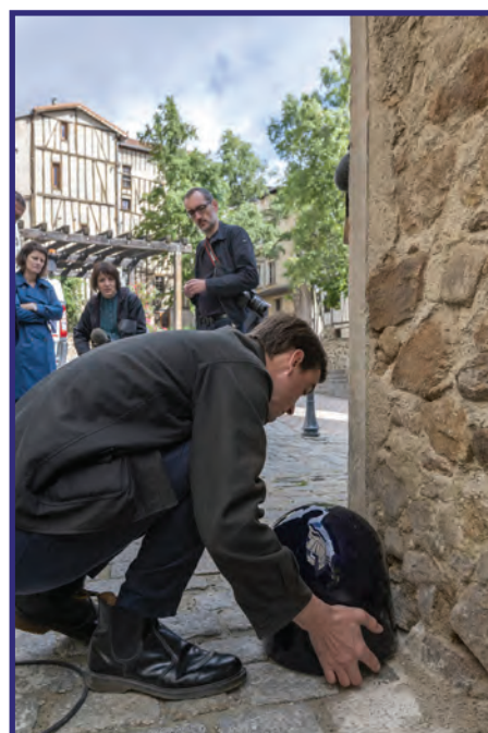
Pose des premières pièces en porcelaine dans la ville, juin 2019