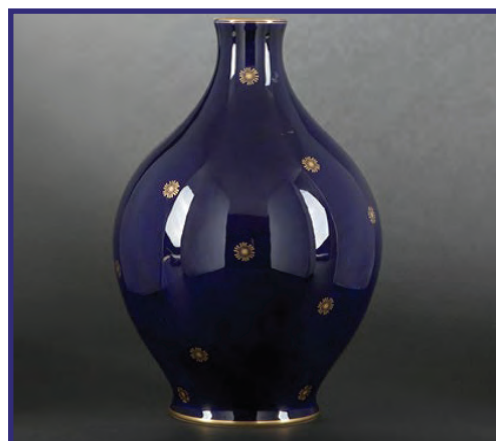
Bleu de four traditionnel

Là où les balisages de randonnée permettent aux marcheurs de trouver leur chemin, le jalonnement urbain est destiné à baliser la ville et à tracer cette voie entre les lieux marquants de Limoges. D'ici fin 2019, une vingtaine de pièces en bleu de four prendront place dans l'espace urbain. Ont déjà été installés :